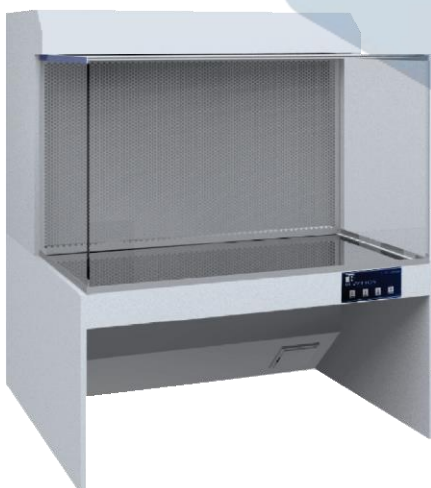
CABINE DE FLUXO LAMINAR HORIZONTAL