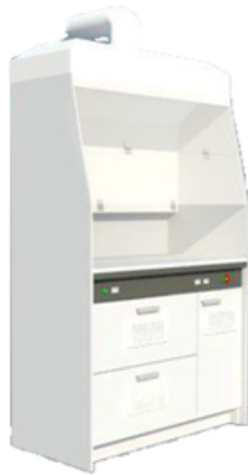
CABINE DE GASES